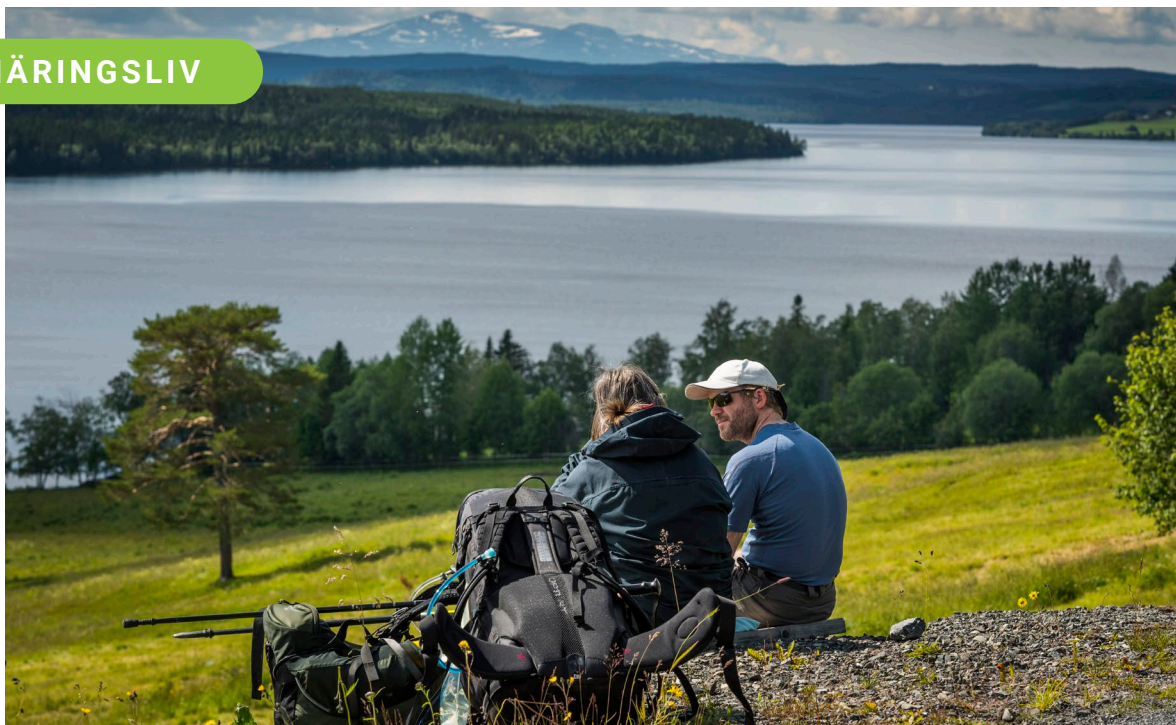
Vyn över Alsensjön och Åreskutan är enligt Putte Eby en av de mest fotograferade platserna längs S:t Olavsleden.