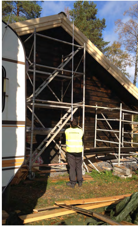
Punkterna i kontrollplanen går igenom vid arbetsplatsbesöken.

Under tiden som bygget pågår genomförs också ett arbetsplatsbesök där punkterna i kontrollplanen går igenom för att säkerställa att allt löper på som det ska. Har du börjat