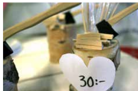
Prydnadssaker som huggkubbar i miniatyr till försäljning för en billig penning.