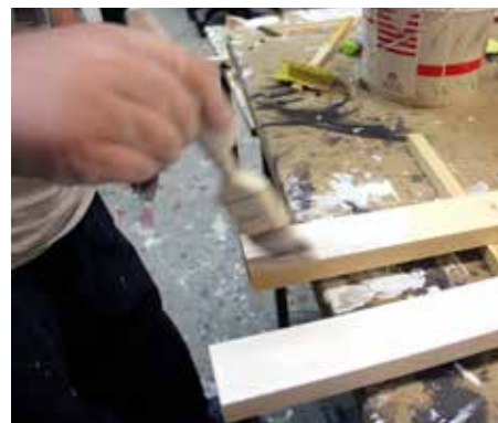
Grundligt utförd målning på stolpar till banmarkeringarna som Sandnässets golfklubb har beställt.