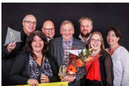
Guldkroken 2016 vanns av Föllingealliansen.