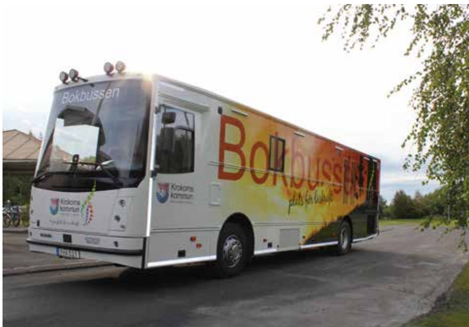
Nu rullar vår nya bokbuss äntligen på vägarna. Bussen rymmer ungefär 4000 böcker och besöken är efterlängtrade på de 53 hållplatserna runt om i kommunen.