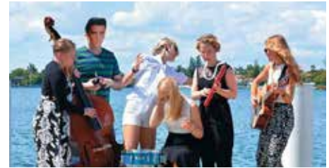
Fröken Elvis 2017