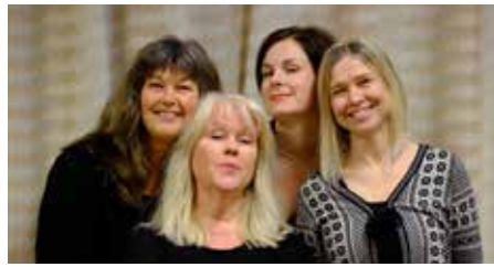
Mödom, Mod och Morska kvinns.