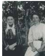
Kvinnliga vardags-hjältar porträtteras.