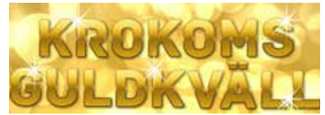
Kulturveckan inleds som vanligt med Krokoms Guldkväll, i år i Krokomshallen. Förstklassig underhållning och spännande prisutdelningar.