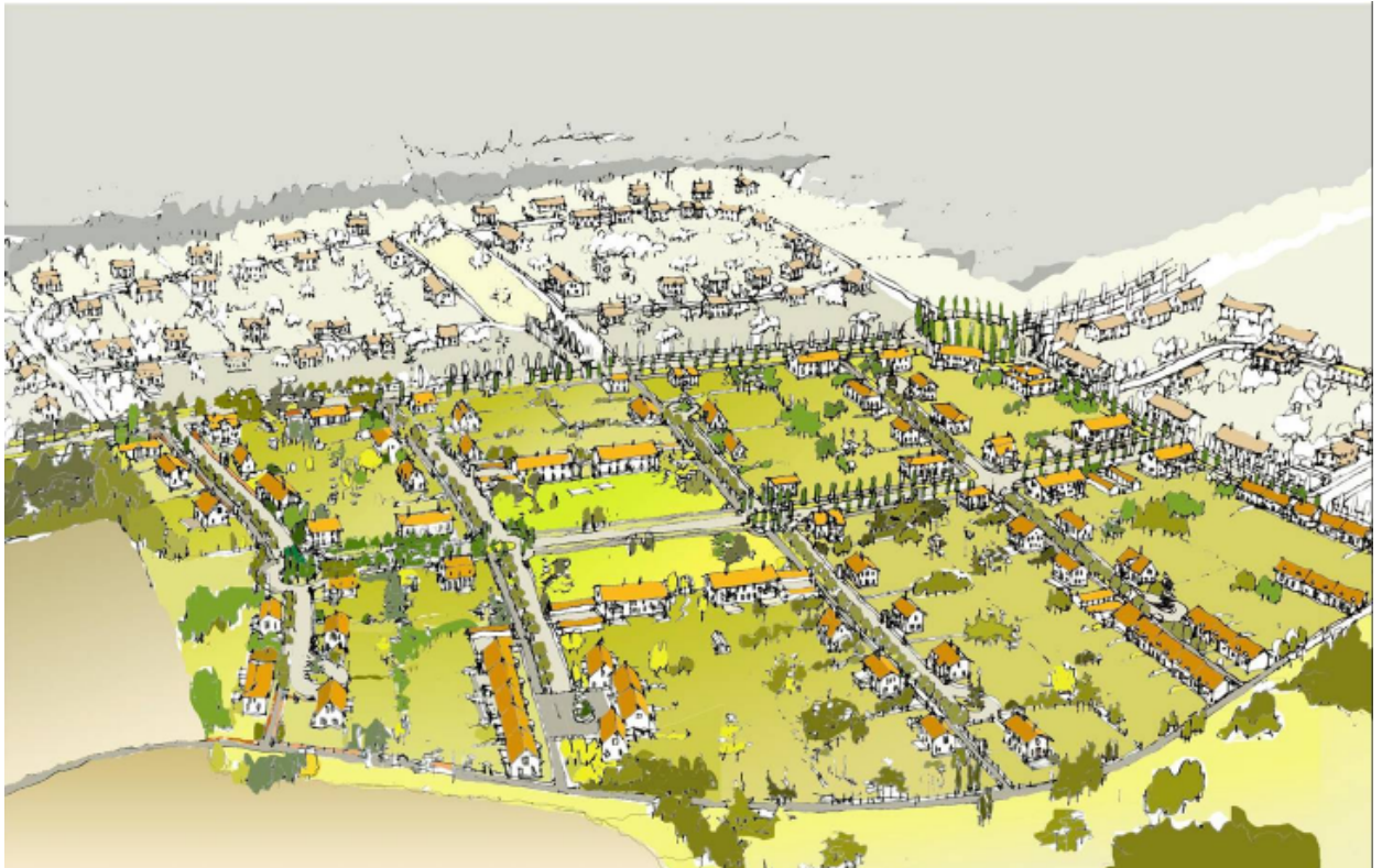
En tänkbar illustration, den aktuella planen ligger i den övre delen av det gulgröna området