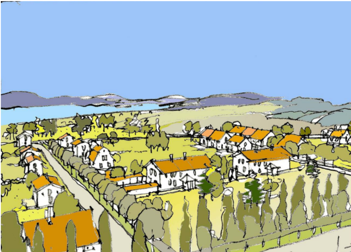
Stor central park, gator med utsikt mot fjällen, kvarter med blandad bebyggelse...