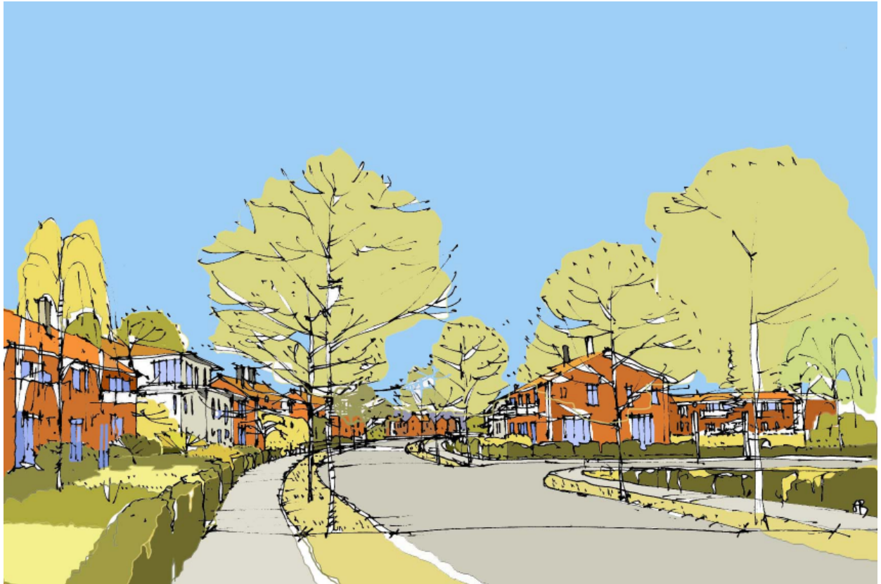
En av de studerade gatuprofilerna för infartsvägen från Åsvägen